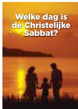
Welke dag is de christelijke Sabbat?