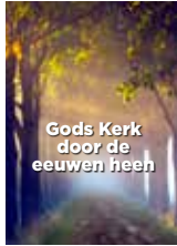
Gods kerk door de eeuwen heen

De volgende boekjes kunnen u helpen een beter begrip te krijgen van Gods plannen voor u en de wereld.