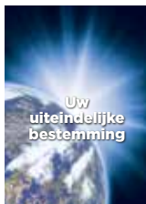
Uw uiteindelijke bestemming

U kunt alle literatuur online bestellen via WereldvanMorgen.nl